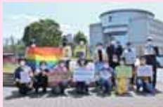
性暴力根絶 フラワーデモに参加

DVなどの相談も増えています。弱い立場の人に手をさしのべ、1人1人が尊重される市政にしていきます。